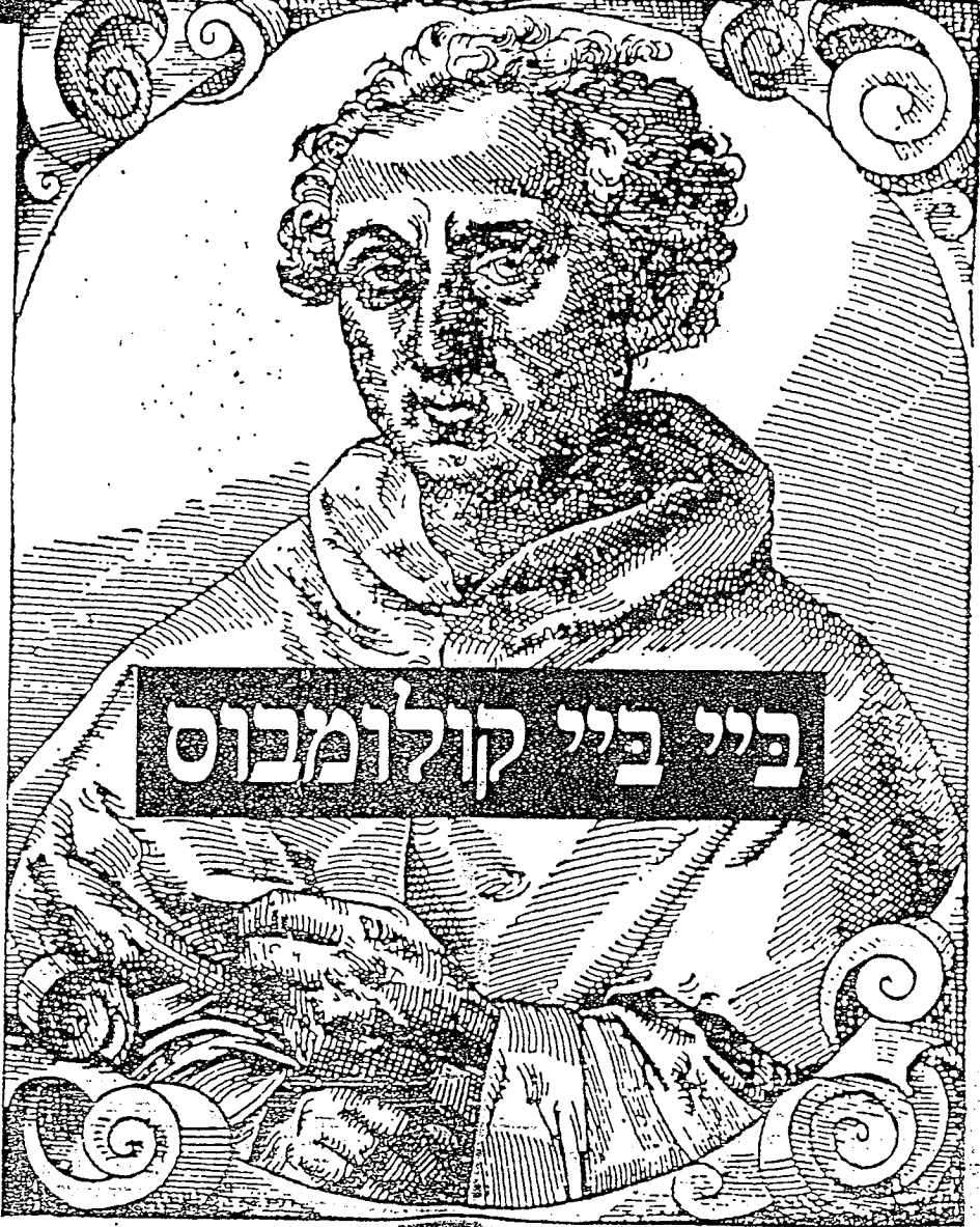
כריסטופר קולומבוס - גילה ולא ידע מה גילה...

מעולם לא יצא מגלה עולם למסעו בצורה כה שיטתית וברעית כפי שקולומבוס הבין את "החומה להודו" שלו. בן גינאה זה היה תוצר מובהק של תרבות דהנסאנס האיטלקי, וכפפו ושרטט מפות הכסיר עצמו משך שנים ארוכות לתכנית נועזת ומהפכנית, אשר העניקה לו לבסוף פרסום בכל רחבי תבל, וקבעה את מקומו לצד ברברי ימי העולם – הציית האוקיאנוס האטלנטי כדי להגיע למרחק הרחוק. קולומבוס הקי את מיטב כפרי הקוסמולוגיה, הקוסמוגרפיה והגיאוגרפיה של משהי מרוחב העולם הישן בכללותו, וזיכו הבקרים כתב העיתות מפרסות בשולי הספרים בהם פיו. מהקרים אלה הם שעלו בכוחו רעיון מקדרי ומהפכני כשהוא נבחרה גיאוגרפית – "החומה להודו". במקום להגיע אל הודו ואל מרכז השחר האגוריים של המזרח הרחוק באמצעות הקפת יבשת אפריקה, אשר עד-לזמנו גודלה האמיתי לא היה ידוע כלל, הציע קולומבוס דרך "קצרה" יותר להודו. הוא הציע להמליג שירותו משרבה תוך הציית "ים הששכה" המסתורי אשר במשך אלפי שנים הטיל אימה, ואף אהר לא העז לחצותו. אך כיוון שועדת מלומדים, אשר הקים מלך פורטוגל, רחנה בשנת 1484 את ההצעה הנודעת הזו, עבר קולומבוס בשנת 1487 לספרה. לאחר-רדיוסו מקסיקום, מבעה. ועתה. המלומדים, בספרה. בדומה לו כפוטנטי. כל מלומדים. שהי. התשקין. לגבי. מתקין. בין ספר. האטה. ולכן בשנת 1491 החלה את הצעתו.